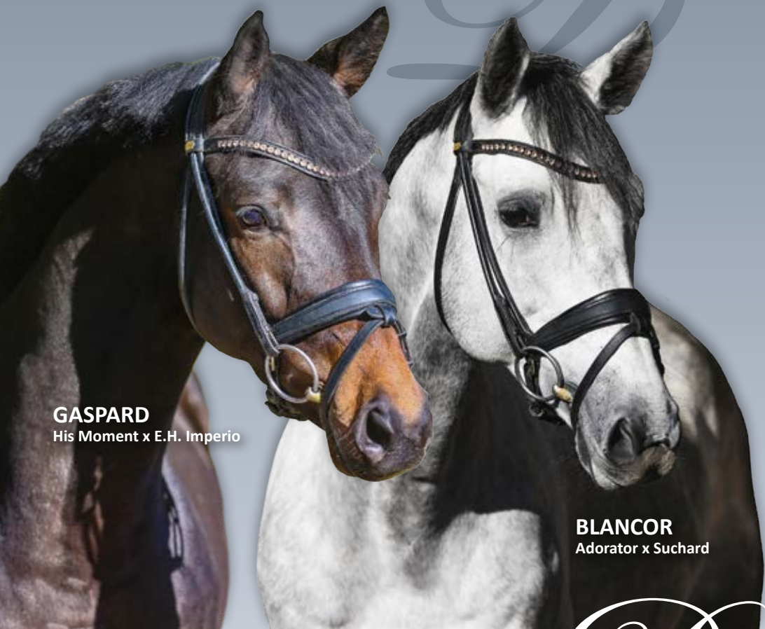
GASPARD His Moment x E.H. Imperio